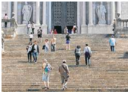
Turistes pujant per les escales de la catedral de Girona. CÈLIA ATSET