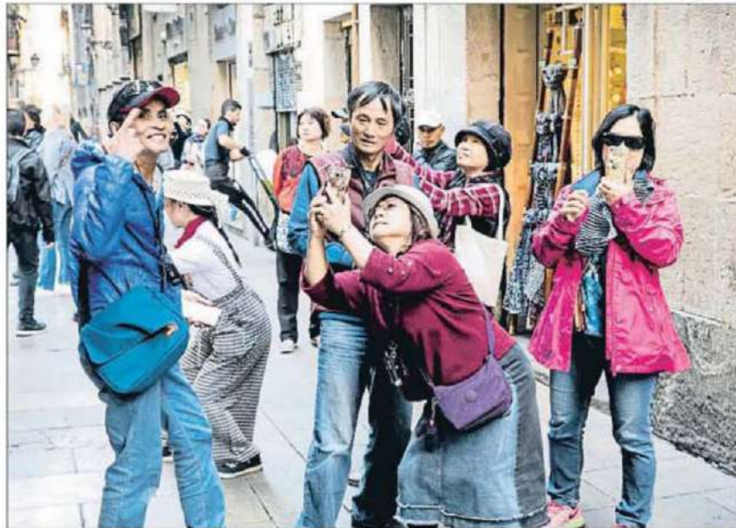
Un grupo de turistas chinos pasea por Ciutat Vella, en Barcelona

El sector prevé mantener las reservas en una semana clave