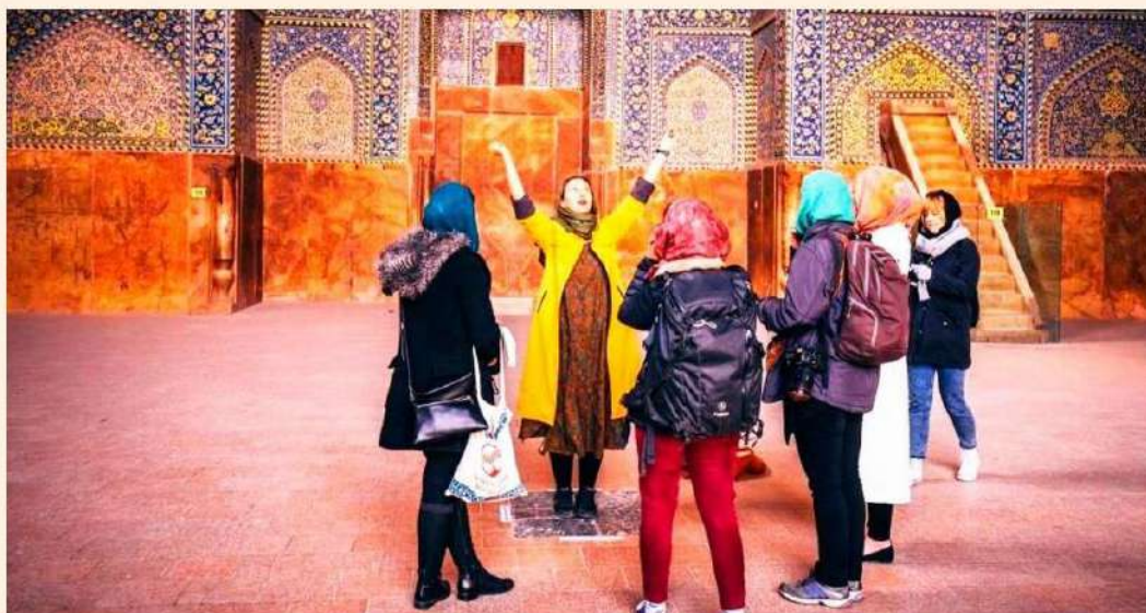
Un grupo de viajeras con una guía turística en un monumento en Irán