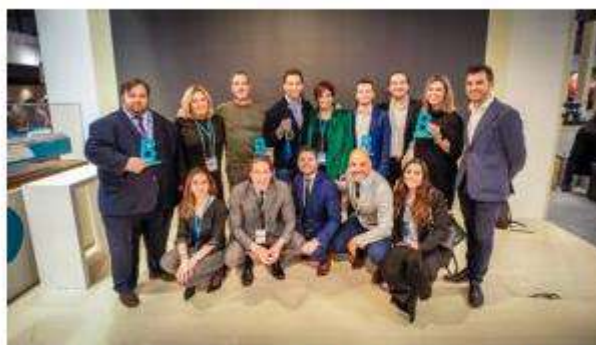
Baleària firma acuerdos en Fitur para mejorar los servicios que ofrece a sus clientes.

Redacción. La naviera Baleària ha aprovechado su presencia en la Feria Internacional de Turismo de Madrid (Fitur) para firmar diversos acuerdos con el fin de mejorar los servicios de sus clientes; tanto de un público más específico (como las familias o los clientes que viajan con mascotas)