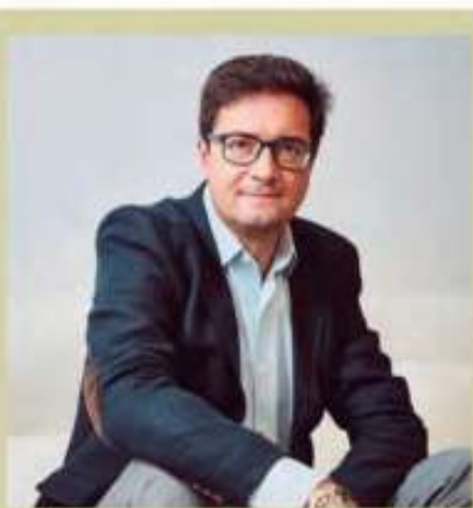
[ÓSCAR LÓPEZ] Presidente de Paradores de Turismo

3. Las ferias son clave para mostrar nuestras novedades, para hacer negocio y para tener contacto cercano con el sector y con los clien-