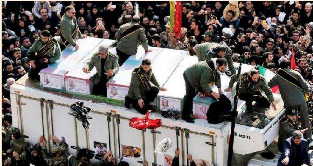
Cortejo fúnebre del general Suleimani en Teherán (Irán)

Más cautos se muestran desde Tuareg Viatges . "Desde hace años que los grupos que enviamos allí sufren bloqueos de tráfico por manifestaciones, cortes de internet o monumentos cerrados por paros. Entendemos que los turistas que eligen este país ya conocen un poco la situación. Están familiarizados con las tensiones que hay en la zona", señalan. Desde Tuareg comparan a Irán con destinos como Líbano o Israel , en los que hay episodios de inestabilidad. "Sabes que puede pasar algo, pero ya conoces dónde vas. A nosotros nos cogió el golpe de Estado en Sudán y los viajeros raramente resultan lastimados o gravemente perjudicados. Es la incomodidad de estar todo cerrado y no poder salir del hotel", explican.