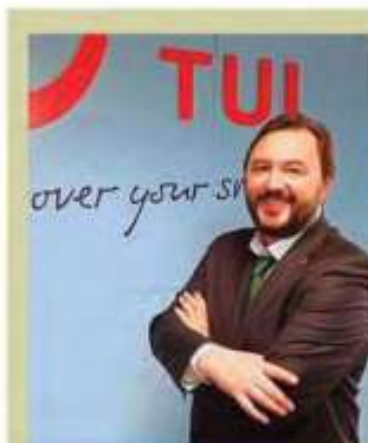
[EDUARD BOGATYR] Director general de TUI Iberia

1. Nuestras expectativas son muy positivas en España con un crecimiento significativo de nuestros vuelos directos entre España y Portugal para este año 2020. Nuestra oferta continúa consolidándose como una de las mejores opciones para volar desde España a más de 90 destinos TAP en Europa, América y África vía Lisboa nuestro HUB principal, con una posición geográfica privilegiada entre los tres continentes. Madrid, Barcelona, Bilbao, Alicante, Valencia, Málaga, Sevilla, Gran Canaria, Tenerife y Santiago de Compostela son las diez ciudades españolas del Mundo TAP. Santiago de Compostela - Lisboa es la nueva ruta de TAP, que ya se puede ven-