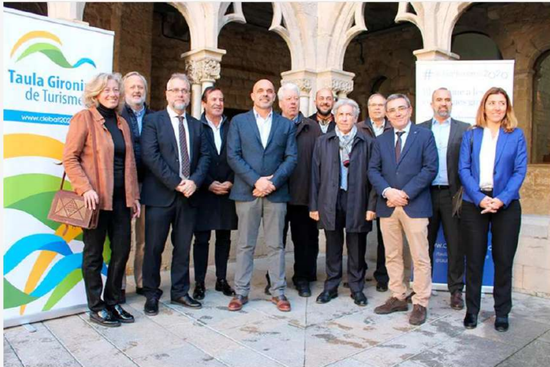
Representants de la Taula de Turisme de Girona