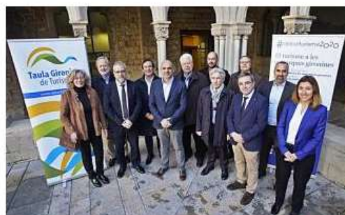
Un tercer bloc de debats sobre turisme gironí, hereu dels de 1976 i

«El turisme de les comarques gironines a debat», vol obrir un espai de reflexió, però no partirà de zero sinó que s'iniciarà tenint en compte l'esforç realitzat als debats anteriors i les conclusions que se'n varen derivar. Els impulsors destaquen que el 2020 és un bon punt d'inici per establir les actuacions necessàries per impulsar el sector turístic els propers anys.