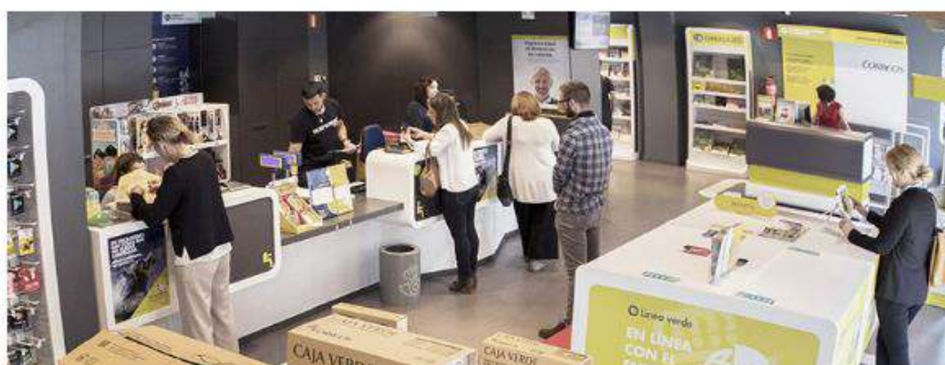
Aspecto de las nuevas oficinas de Correos en las que se muestra la diversificación de productos en venta.

Lamenta Sarrate "que tengan que ser las agencias las que denuncien y no sea la inspección" de la Administración, que es la encargada de vigilar que se cumpla la legislación.