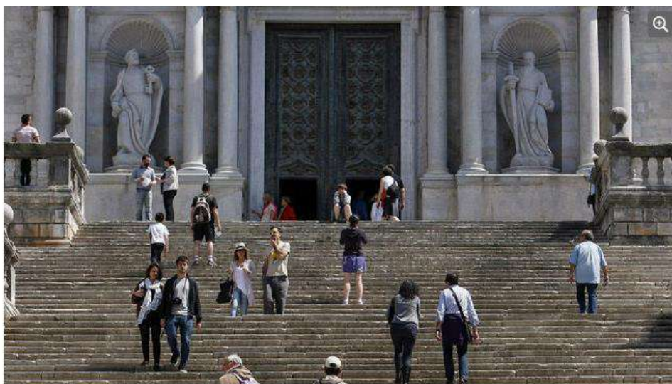
Turistes pujant per les escales de la catedral de Girona.

Joan Roca, del restaurant El Cellar de Can Roca, pronunciarà avui la conferència inaugural del primer dels grans debats que han de definir les línies estratègiques de futur del turisme a les comarques gironines. Roca parlarà sobre la restauració gironina al màxim nivell de qualitat.