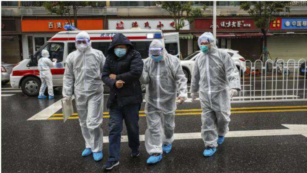
Personal médico ayuda a un paciente en Wuhan (China), el 26 de enero.

Las agencias de viaje especializadas españolas y aerolíneas con vuelos entre España y China ya han dado el primer paso ante la crisis del coronavirus, que se ha cobrado más de 100 vidas . La mayoría de empresas del sector aconseja anular o modificar los vuelos contratados al país asiático. Y las aerolíneas facilitan que se realice sin coste adicional. “Estamos ayudando a nuestros clientes a cambiar las fechas de los viajes o a cancelarlos. Las aerolíneas nos están dando facilidades”, confirmó este martes a EL PAÍS Carlos Garrido, presidente de la Confederación Española de Agencias de Viajes (CEAV).