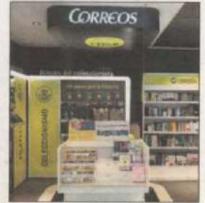
Las vende desde diciembre.

Cabe recordar que en el año 2008, mediante una alianza con Viajes Crisol (propiedad de Marsans) creó la marca TurCorreos para vender recargas de talones de hotel. Esta iniciativa, que despertó un gran rechazo por parte del Sector de agencias de viajes, se desvaneció a raíz de la quiebra del Grupo Marsans en el año 2010. Con este nuevo proyecto, Correos busca aprovechar el potencial de su red de oficinas como canal de distribución por su capilaridad y cobertura (recibieron más de 93,5 millones de visitas a lo largo de