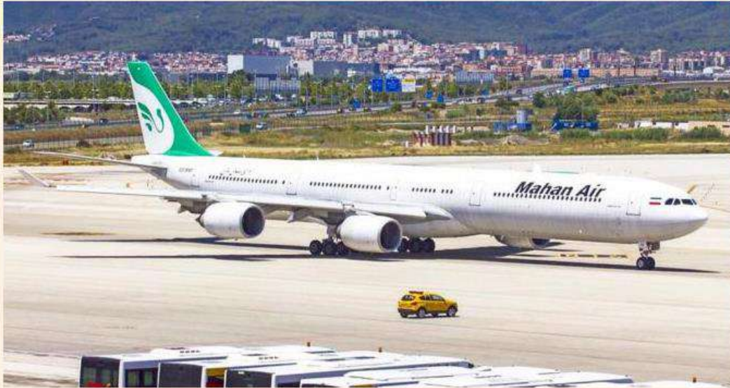
Una aeronave de Mahan Air en pista en el aeropuerto de Barcelona-El Prat