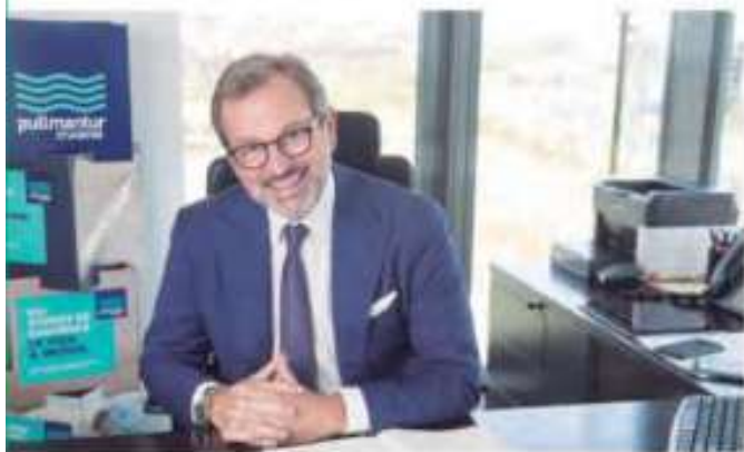
[RICHARD J. VOGEL] Presidente & CEO de Pullmantur Cruceiros

1. Nuestras expectativas para el 2020 son positivas. Concretamente en España – y a pesar de los cambios en nuestra flota – esperamos mantener un volumen de pasajeros muy similar al alcanzado en 2019 gracias al crecimiento que experimentaremos en el Norte de Europa.