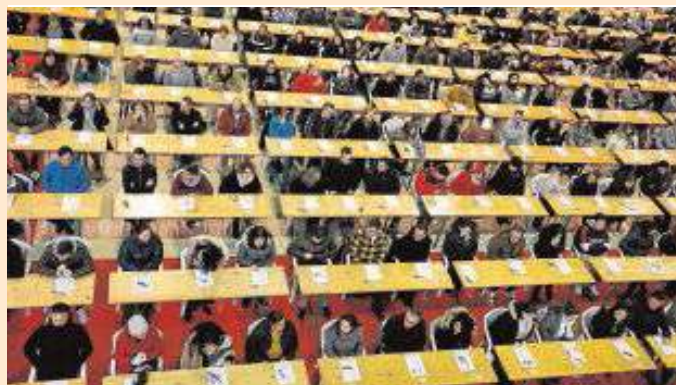
9.700 personas se examinaron ayer en Silleda, Pontevedra

Pero estas explicaciones no dejan satisfechas a las agencias de viajes. Para empezar, desde el sector destacan que son las agencias de viajes de El Corte Inglés o Carrefour las que venden estos paquetes vacacionales. Además, Garrido advierte de que «la irrupción de Correos sí puede provocar el cierre de un buen número de pequeñas agencias». Y sobre la capilaridad de la red de la empresa pública, el presidente de CEAV recuerda que «hay ya distribuidas 8.000 agencias en España que tienen una fuerte competencia entre sí». «No se combate la España vaciada; se da un sentido comercial a una empresa pública», sentencia Garrido.