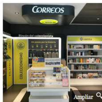
Se venden en oficinas de ciudades desde las que tiene aeropuerto de salida.

Mediante este acuerdo, Waynabox se convierte en la primera empresa con la que cuenta Correos para ofrecer cajas de viajes sorpresa, ampliando nuevamente la oferta de productos turísticos . Y es que, como publicó NEXOTUR, bien a través de su red de oficinas o en su página web da la posibilidad a sus clientes de adquirir billetes de Renfe (AVE, media y larga distancia) y reservar entradas a espectáculos y noches de hotel .