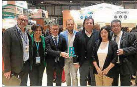
Servicio al cliente. Baleària premia a la patronal AVA por el servicio que ofrece a los clientes de las Islas para incrementar los viajes en la naviera.

La naviera ha renovado su adhesión a la Asociación Corporativa de Agencias de Viajes Especializados (ACAVE) y a la Confederación Española de Agencias de Viajes (CEAV). Además, en el encuentro