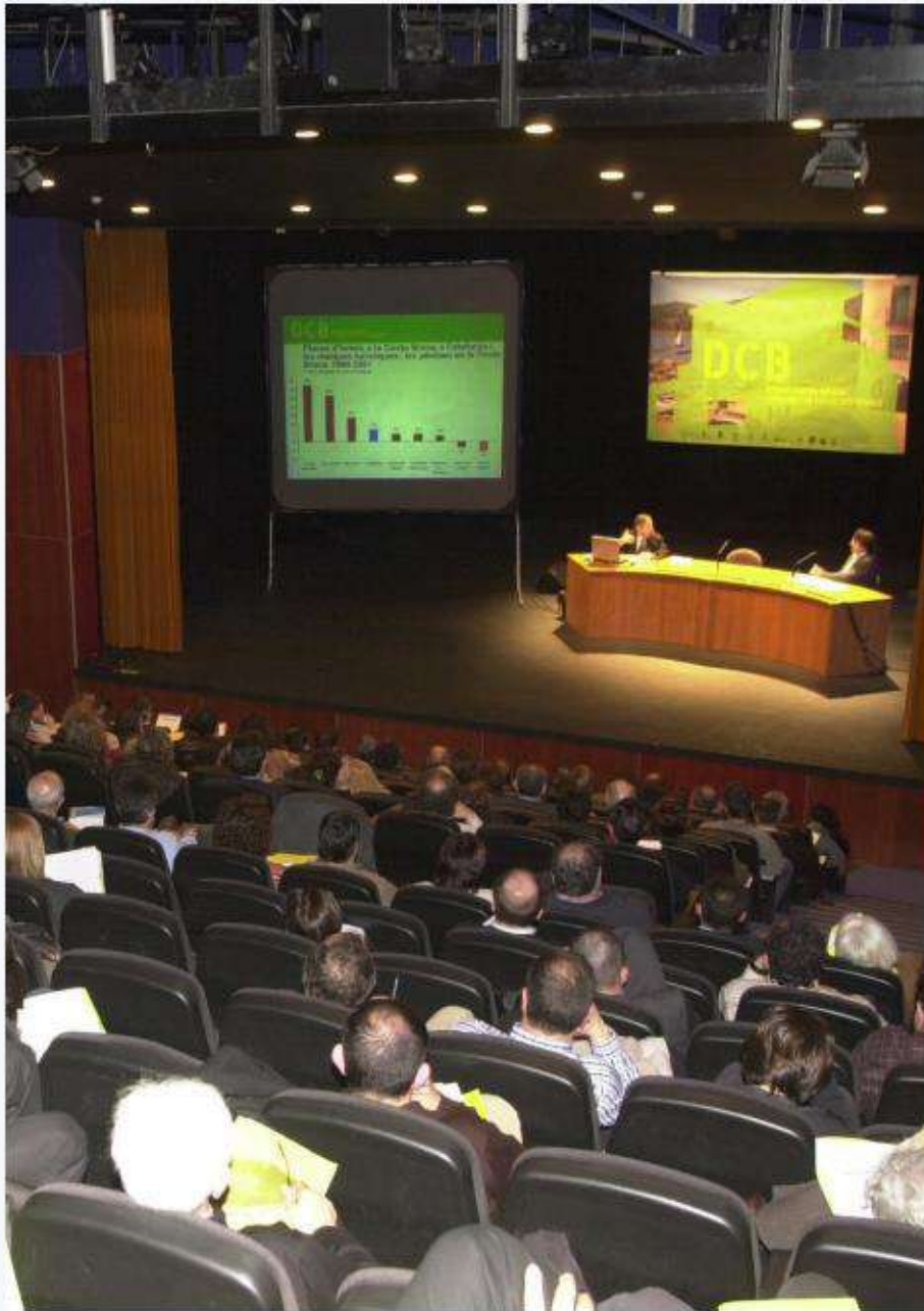
Un dels debats Costa Brava, en una imatge del 2004 Q.P