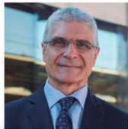
[ISAÍAS TÁBOAS] Presidente de Renfe

3. A nivel nacional, procuramos asistir al máximo de ellas y es un gran escaparate, sobre todo, para ver las tendencias de mercado, negociar proveedores y ver algunos clientes. Ferias como FITUR, generalistas de turismo, o EIBTM, para segmento MICE, son fijas. También algunas como B-Travel o Expovacaciones son algunas de las visitadas, igualmente.