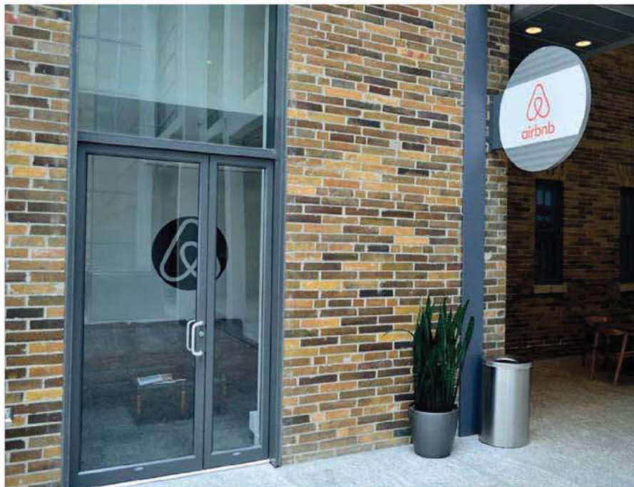
España es el tercer mercado de Airbnb, sólo por detrás de Estados Unidos y Francia, con 6.000 millones de euros de negocio.

aporta ninguna seguridad jurídica ni a las viviendas ni a los usuarios ni a los competidores ni a nadie”, denuncia.