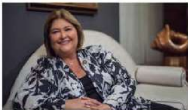
[MARÍA AMALÍA REVELO] Ministra de Turismo de Costa Rica

3. Las ferias son un gran escenario para el sector turístico donde las posibilidades de networking se multiplican. Próximamente, Fitur será la gran protagonista, ya que cada año, las cifras demuestran que el sector goza de buena salud.