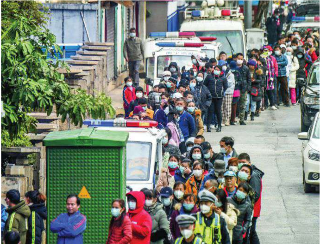
Personas haciendo cola para comprar mascarillas faciales en una compañía de suministros médicos de Nanning, en el sur de China

Un hombre ingresó anoche en aislamiento en el Hospital Regional de Málaga por un posible caso de coronavirus, habida cuenta de que en los últimos días el mismo podría haber estado en contacto con personas de la zona de China en la que se han producido casos de contagio.