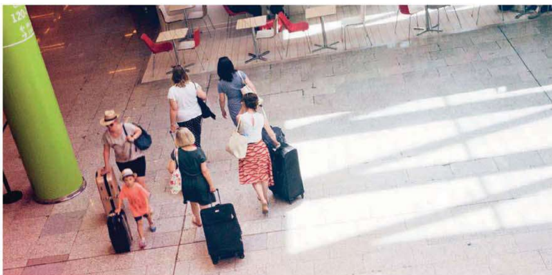
Los hoteleros españoles ven a las viviendas de uso turístico como un competidor directo por el mismo cliente, ya sean parejas, familias o grupos.

“ En Baleares y las ciudades de Barcelona, Madrid y Valencia aún está en litigio la regulación ”