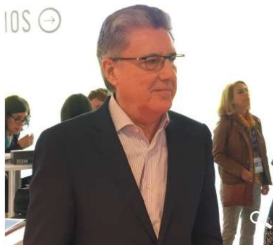
Sarrate ha celebrado la subida del Salario Mínimo Interprofesional (SMI) al estar "desfasado" en comparación con los del resto de la Unión Europea.

En 2019, el 60% de las empresas consultadas por Acave ha incrementado su facturación en 2019 entre un 5% y un 10%, mientras que un 40% considera que ha sido menor del 5% o igual que 2018. Por otro lado, más el 90% de los encuestados afirmaron que las reservas efectuadas hasta el momento se sitúan en línea con las expectativas del sector para estas fechas.