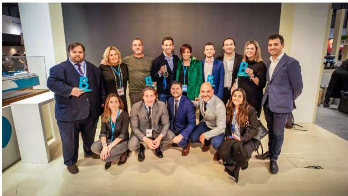
Equipo Baleària en Fitur este año.

La naviera Baleària ha aprovechado su presencia en la Feria Internacional de Turismo de Madrid (Fitur) para firmar diversos acuerdos con el fin de mejorar los servicios de sus clientes; tanto de un público más específico (como las familias o los clientes que viajan con mascotas) como para los pasajeros en general gracias a las colaboraciones para potenciar las experiencias en los destinos. La naviera también ha mantenido numerosos contactos y reuniones con agencias de viajes.