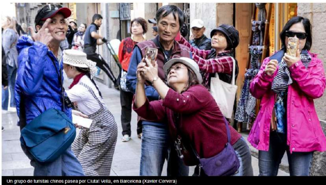
Un grupo de turistas chinos pasea por Ciutat Vella, en Barcelona

• El sector prevé mantener las reservas en una semana clave