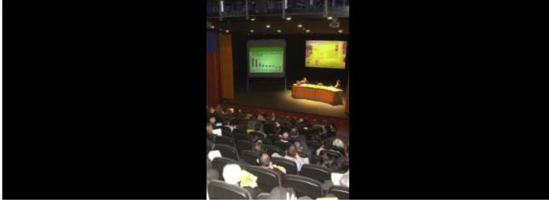
Un dels debats Costa Brava, en una imatge del 2004 Q.P