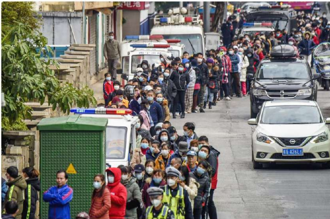
People line up to buy face masks from a medical supply company in Nanjing in southern China's Guangxi Zhuang Autonomous Region. Wednesday, Jan. 29, 2020. Countries began evacuating their citizens Wednesday from the Chinese city hardest-hit by a new virus that has now infected more people in China than were sickened in the country by SARS.

El coronavirus podría alcanzar su pico en 10 días La OMS se reúne hoy para valorar si constituye una emergencia internacional, mientras Iberia y otras aerolíneas suspenden sus vuelos a China