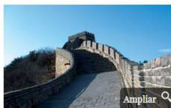
Tramos de la Gran Muralla China permanecen cerrados.

El brote de coronavirus impacta en el emisor español, provocando numerosas cancelaciones a pesar de que los casos se concentran en la provincia de Hubei. Exteriores únicamente desaconseja visitar a esta zona del país, si bien advierte del cierre de lugares turísticos y de las medidas adoptadas por las autoridades chinas.